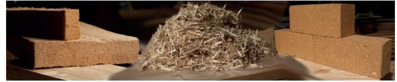
L'isolation des sols, murs et plafonds, avec matériaux naturels par l'entreprise «ELECTRA ORGANIC»

Définition: le bien-être de l'homme sous la forme d'une harmonie avec son environnement naturel.